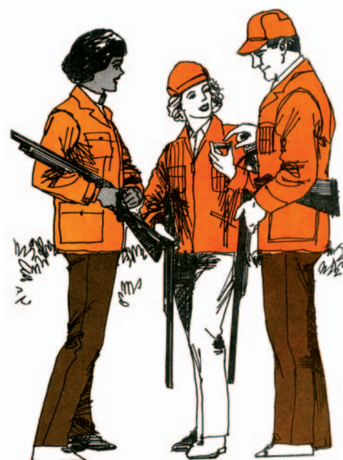
• Ο χειρισμός της κάνης του όπλου έχει ιδιαίτερη σημασία

Τα πυρομαχικά φυλάσσονται και αυτά σε κλειδωμένο ερμάριο, χωριστά από τα όπλα. Καλό είναι τα όπλα να μη φυλάσσονται μέσα σε θήκη, γιατί πολλές φορές οι θήκες εγκλωβίζουν υγρασία και αναπτύσσονται ανεπιθύμητες οξειδώσεις. Σε καμία περίπτωση δεν επιτρέπεται να αποτελούν παιχνίδι των παιδιών.